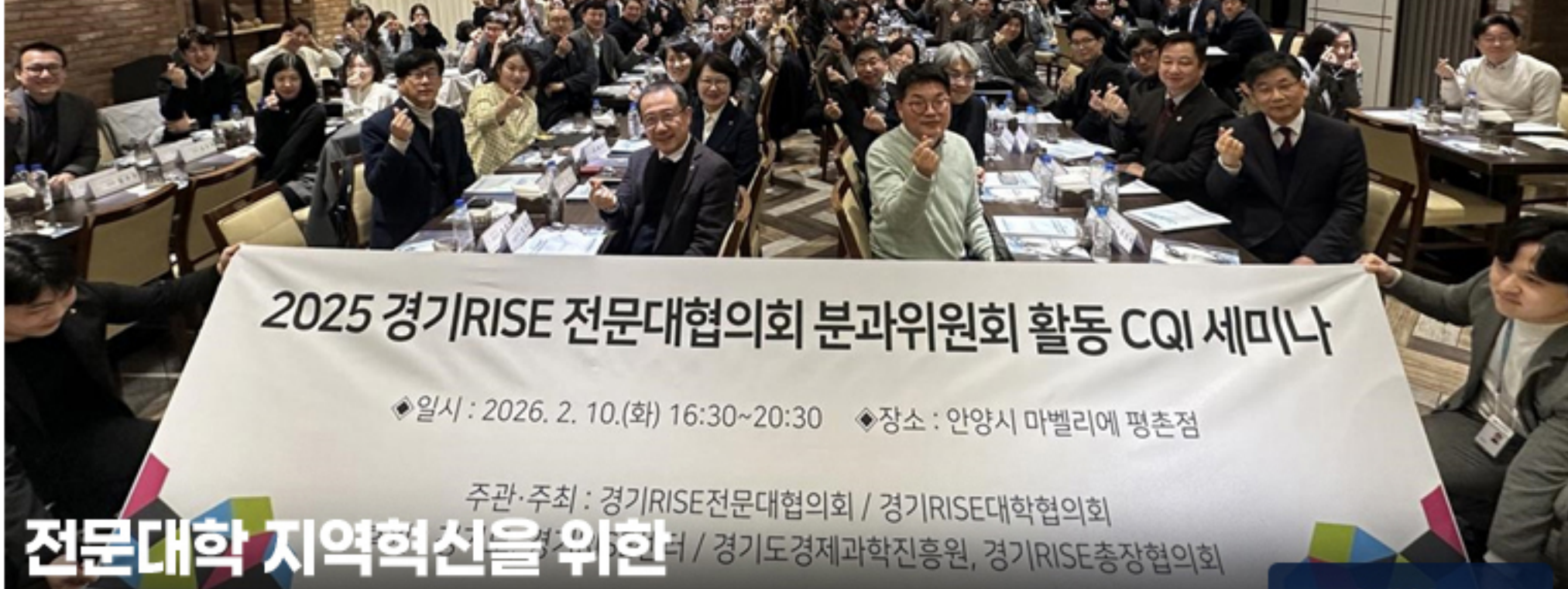
전문대학 지역혁신을 위한 분과위원회 CQI 세미나 개최