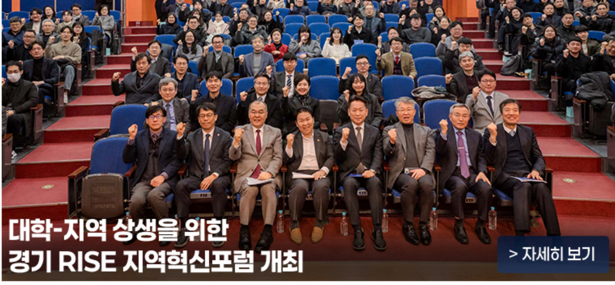
대학-지역 상생을 위한 경기 RISE 지역혁신포럼 개최